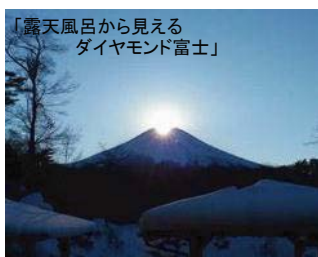
「露天風呂から見える ダイヤモンド富士」

今回は、山中湖温泉『紅富士の湯』をご紹介します。 名前の由来の通り、『紅富士』をお風呂から見る事が出来る温泉です。紅富士とは日の出直前の12分間だけ富士山の雪が赤く染まる現象です。因みに今は7時頃に見られるそうです!!その日の状況で真っ赤になったりほんのりだったり富士山の色々な表情が楽しめます。紅富士の湯では、12月~2月の土・日・祝日限定で朝6時から営業しています。是非、神秘的な富士山をお風呂から眺めて至福のひと時をお楽しみください。また、施設内のお食事処「四季彩」や大食堂では、山中湖のワカサギを使った料理や紅富士商店組合お薦めの「まりもコロッケ」や桔梗信玄餅とのコラボ商品「信玄ソフト」などグルメも充実しています。お風呂上りでゆっくりと寛ぐスペースも広く、個室を確保することも。用途に合わせてお楽しみ頂ける施設です。是非一度、足をお運びください!!