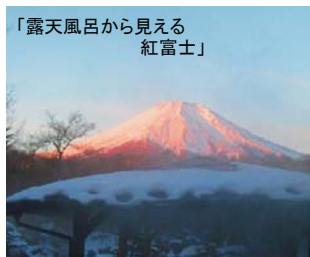
「露天風呂から見える 紅富士」