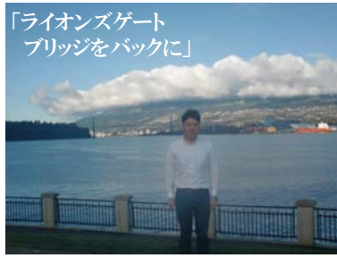
「ライオンズゲート ブリッジをバックに」

次に隣町のペンバートンにあります、ログの加工場 へ向かいました。加工場は雪が積もっていてログが 隠れてしまっていたのですが、車を降りた途端、レッドシ ダーの香りがあたり一面に漂っており、また一本、一 本太く年輪が密な上質なログで本場のウェスタンレ ッドシダーの質の良さを実感しました。