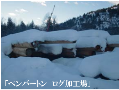
「ペンバートン ログ加工場」

次に隣町のペンバートンにあります、ログの加工場 へ向かいました。加工場は雪が積もっていてログが 隠れてしまっていたのですが、車を降りた途端、レッドシ ダーの香りがあたり一面に漂っており、また一本、一 本太く年輪が密な上質なログで本場のウェスタンレ ッドシダーの質の良さを実感しました。