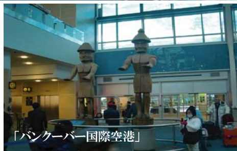
「バンクーバー国際空港」