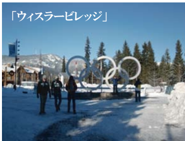
「ウイスラーピレッジ」

翌日から、いよいよログハウスの視察です。さすが本場カナダのウェスタンレッドシダーログハウス。どの建物 を見ても迫力満点。従来のハンドカットログハウスの概念を180度、覆されました。