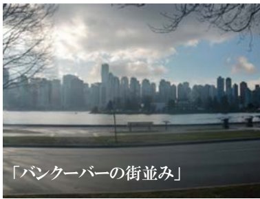
「バンクーバーの街並み」

ウイスラーはバンクーバーオリンピック開催地として世 界のスキーヤーの聖地となっています。