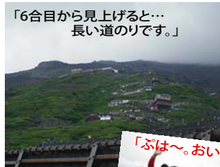
「6合目から見上げると…長い道のりです。」