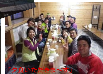
「夕食いただきます!」