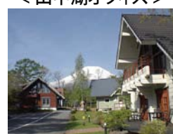
山梨県南都留郡 山中湖村山中350-1