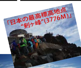
「日本の最高標高地点“剣ヶ峰”(3776M)」

まだ登った事の無い方は是非チャレンジしてみてください。最高の思い出の1ページになる事間違いありません♪