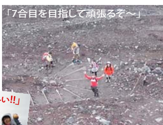
「7合目を目指して頑張るぞ〜」