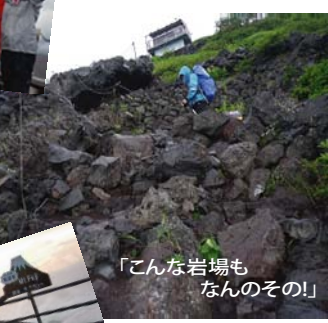
「こんな岩場もなんのその!」