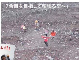
「7合目を目指して頑張るぞ〜」