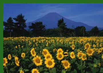
富士山とひまわり畑

今年も富士登山を行いました。天候に恵まれ素晴らしい山行でした。天気は左右されますが、山にトライすることで謙虚さや、素直な心になること人間は生かされていることを教えて頂けます。日本一の富士の頂きで来年も輝く朝日を見たく思います。大自然にただただ感謝です。