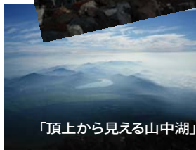
「頂上から見える山中湖」