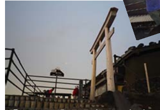
「1日目のゴール8合目“元祖室”」