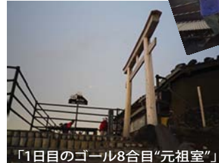
「1日目のゴール8合目“元祖室”」