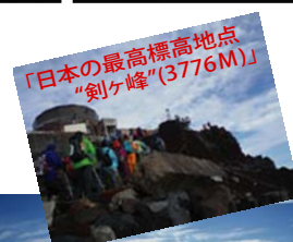
「日本の最高標高地点“剣ヶ峰”(3776M)」

まだ登った事の無い方は是非チャレンジしてみてください。最高の思い出の1ページになる事間違いありません♪