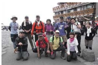
「5合目出発前の記念撮影」