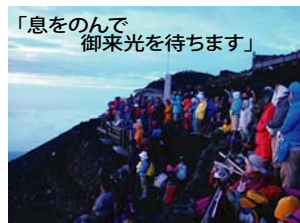
「息をのんで御来光を待ちます」

る時間になってしまいました。早朝1時30分起床、2時山小屋出発。この時の体調は、足の疲れが残っていたり寝不足ではありましたが、頭はすっきりとしていて清々しい気持ちでした。ここからはさらに空気が薄くなるため、呼吸を整えながらゆっくりと登りました。9合目辺りの岩場は頂上を目指す登山者で渋滞が起きており、時間が経つにつれて徐々に明るくなっていく空に、「間に合うかなあ〜??」という焦る気持ちが…。しかし、茜色に染まりはじめた空は今までに見たことの無い神秘的なもので、自然の美しさを改めて感じた瞬間でもありました。ごつごつとした岩場をよじ登り、頂上までもうすぐです。ついに頂上に到着!! 時計を見ると4時31分を指していました。最後の一段を踏みしめた時は言葉に出来ないくらいの達成感が全身を流れていきました。その間にも茜色の空はますます濃い色になっていきます!! もうすぐです。みんなドキドキしながら御来光を待ちます。