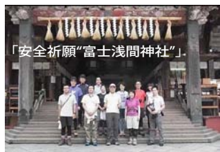
「安全祈願“富士浅間神社”」