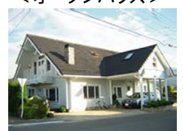
山梨県富士吉田市 新西原2-25-10