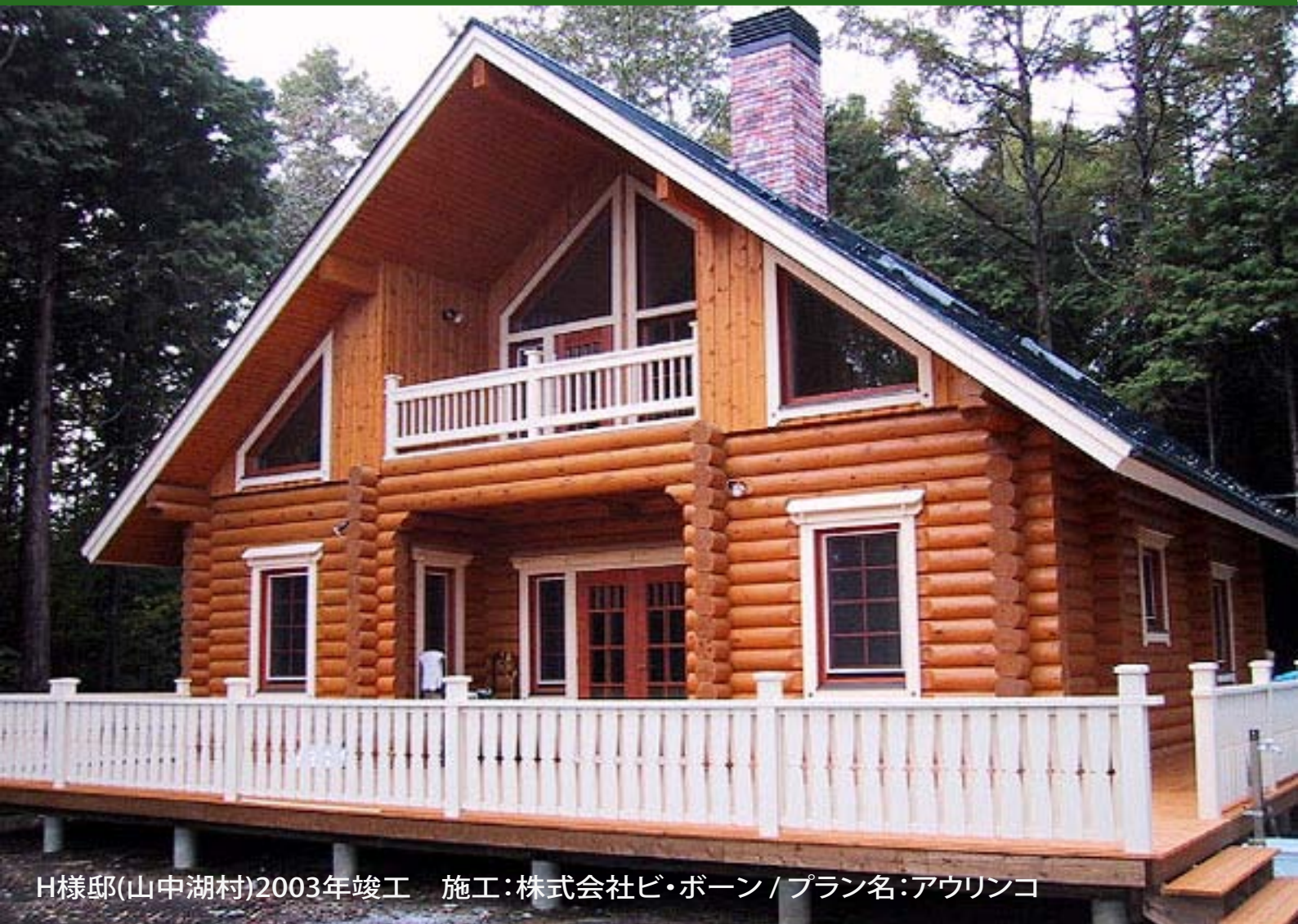
H様邸(山中湖村)2003年竣工 施工:株式会社ビ・ボーン/プラン名:アウリンコ