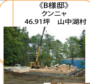
《B様邸》 クンニヤ 46.91坪 山中湖村