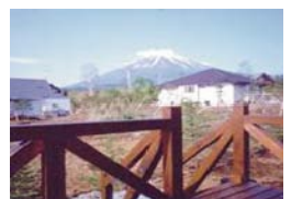
富士ドクタービレッジ