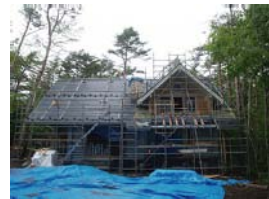
《S様邸》 アロミ 59.80坪 山中湖村