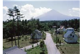
富士桜高原別荘地