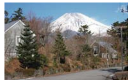
富士急十里木高原別荘地