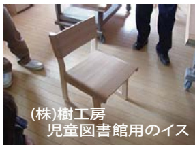
(株)樹工房 児童図書館用のイス