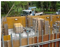
《C様邸》 ヴォイマ 24.96坪 山中湖村