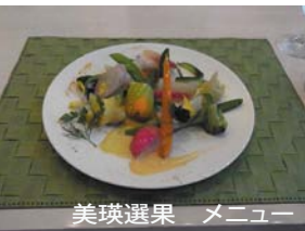
美瑛選果 メニュー