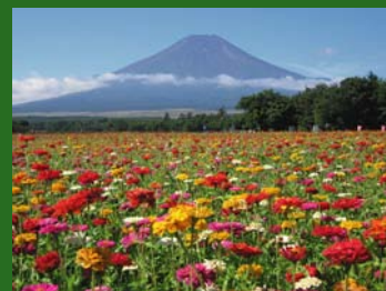
山中湖「花の都公園」より 百日草と富士山

台風4号にて多くの被害にあわれた地域の方々に改めてお見舞い申し上げます。梅雨明けと共に新緑から深緑生命みなぎる夏の到来です。暑い夏がやってきます。