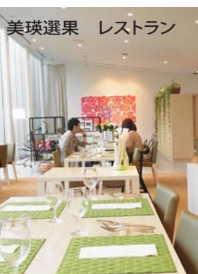
美瑛選果 レストラン