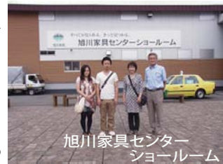
旭川家具センター ショールーム