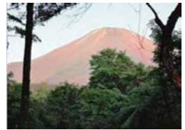
富士急山中湖畔別荘地