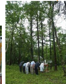
《D様邸》 タルモ 27.41坪 山中湖村