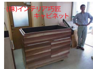
(株)インテリア巧匠 キッチン