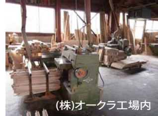
(株)オークラ工場内