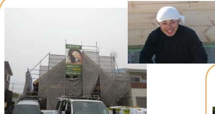
《A様邸》 ヤルヴィ 30.86坪 御殿場市