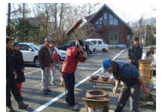
《よいしょ!よいしょ!》