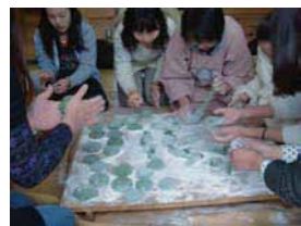
《みんなで草餅を丸めました♪》

気がつけば今年も残りあと1ヶ月となりました。弊社スタッフ一同、皆さんともっともっと楽しい思い出を作りたいと、このイベントを企画しました。昨年大好評だったこの企画。“杵と臼”を使って行う本格的な餅つき大会です。熱々のもち米をみんなで力を合わせてついていき、出来たてのやわらかいお餅をみんなでほおばりながら、今年の