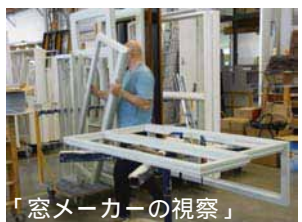
「窓メーカーの視察」

次に、木製窓メーカーを視察しました。木材の乾燥やカットなどの工場工程はなんとも楽しく、何時間見ても飽きません。なんと建具工場で建物の骨組み部分までつくっていました。とにかく工場の品質管理がしっかりしていることに驚きました。