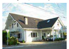
山梨県富士吉田市 新西原2-25-10