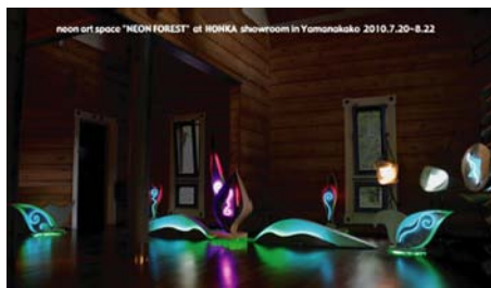
『ホンカデザインセンター』 開催中!