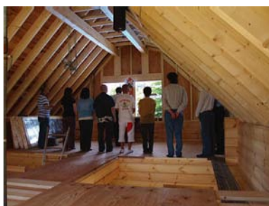
K邸（長坂町）別荘 上棟おめでとうございます。