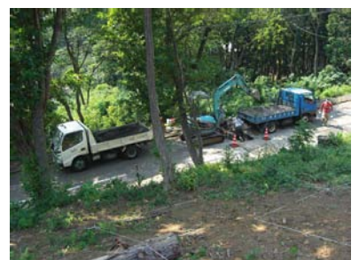
I邸（熱海市）別荘 水道取出し工事